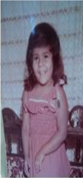
1975 4 años