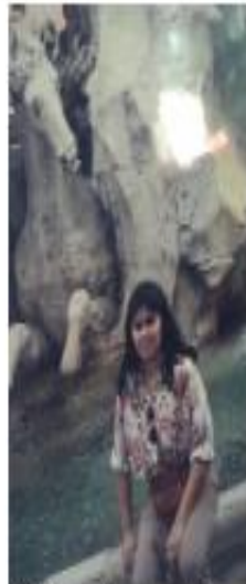
1996 Roma Peregrinación