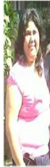
Síndrome de Cushing 2009