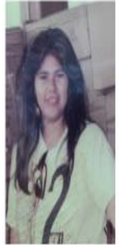
1990 20 años Primer Trabajo