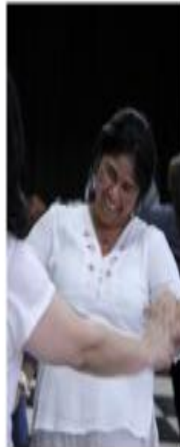
2015 Danzando la Vida