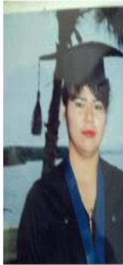
19 años T.S.U