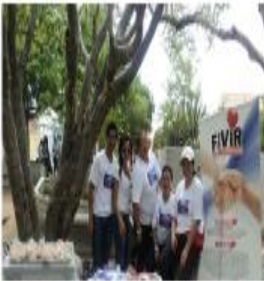
Fundación Ayúdame a vivir FAVIR 2012