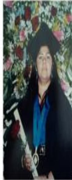
2007 Grado de Arquitecta