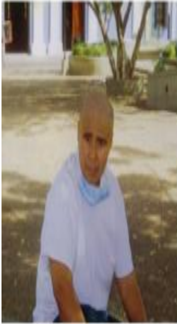
2003 32 años