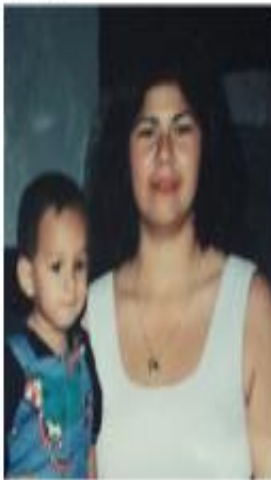
1996 25 años